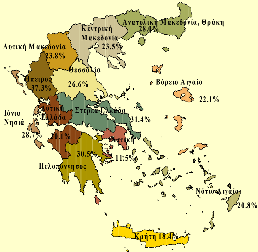
Χάρτης 1. Κίνδυνος φτώχειας κατά περιφέρεια, 2003.

Πηγή: Μπαλούρδος και Υφαντόπουλος, 2007. Κικίλιας 2005. Χρηματοδότηση έρευνας από το Ε.Π. «Ανταγωνιστικότητα» (Ε.Π.Α.Ν.)