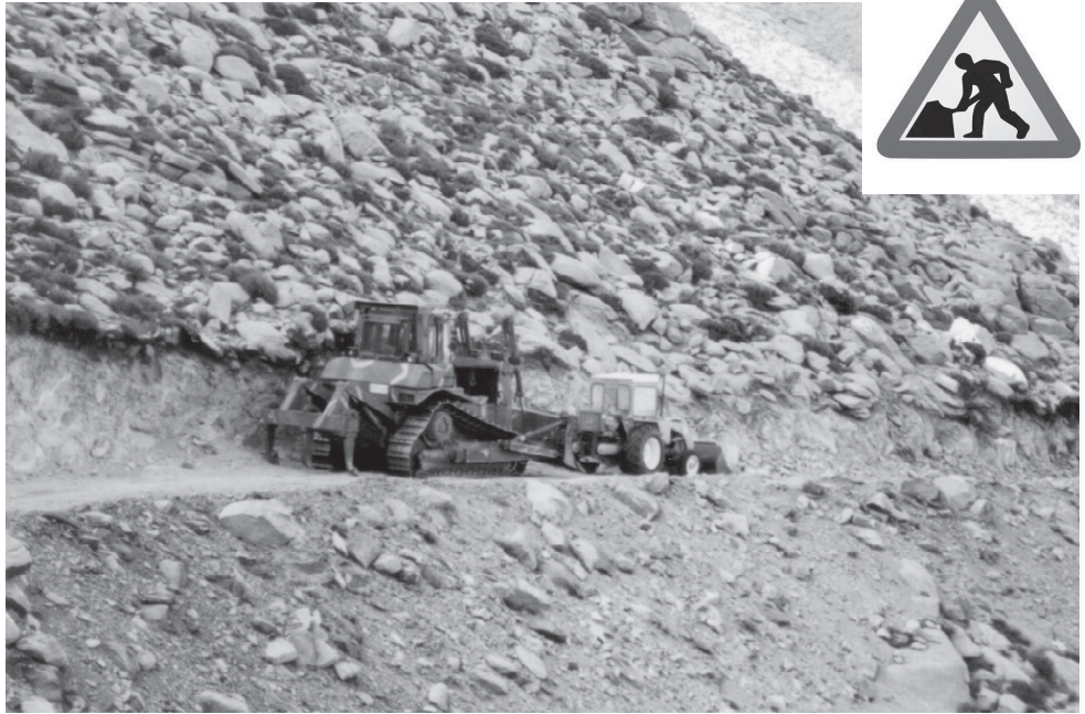
Διάνοιξη του δρόμου Καρκινάγρι-Μαγνανίτης

στη στήλη αυτή φιλοξενούμε ειδήσεις για τις εξελίξεις και τα έργα που συμβαίνουν στο Δήμο Ραχών, ύστερα από επικοινωνία μας μαζί του.